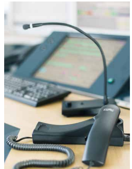
Der formschöne und robuste Plathosys CT 260 PRO Handapparat mit PTT/PTM-Funktion