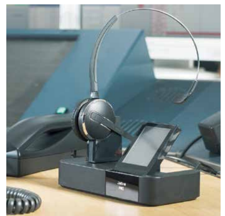
Die perfekte Ergänzung: schnurlose Headsets z. B. von Jabra