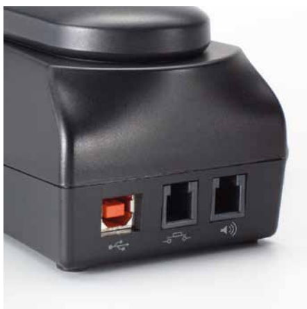
Vielseitige Anschlussmöglichkeiten zeichnen das CT 260 PRO aus