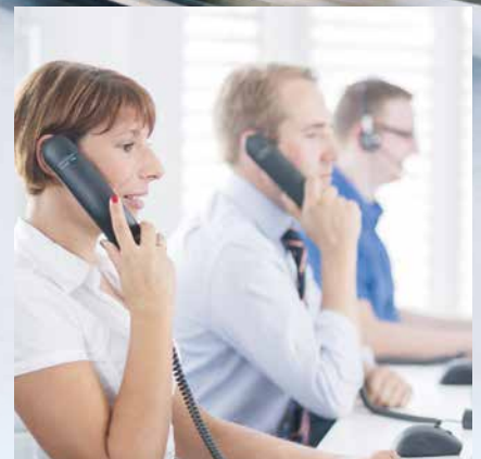
Aus der Praxis entwickelt: Plathosys Produkte