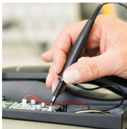
Individuell auf die Wünsche unserer Kunden abgestimmt